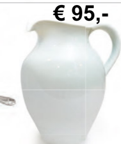
€ 95,- Krug classic 1 Liter