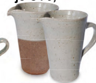
je € 70,- Krug konisch halb- oder ganz gliert, 1 Liter