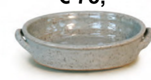
€ 75,- Brat- und Auflaufform fr's Backrohr ganz gliert, Lnge ca. 27 cm

...energetisiert Wasser, Krper und Geist!