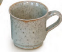
€ 28,- Hferl ganz gliert, 0,25 Liter