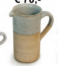
€ 70,- Krug zylindrisch halb gliert, 1 Liter