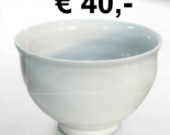
€ 40,- Ess- und Trinkschale 0,4 Liter, ø ca. 16 cm