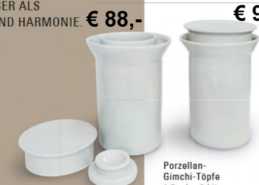
€ 88,- € 98,- Porzellan-Gimchi-Tpfe 1,5 oder 2 Liter

BIOENERGETISCH AKTIVIERTES WASSER ALS BERMITTLER VON LEBENSFREUDE UND HARMONIE. SPENDET ENERGIEN AUF MENSCHEN, TIERE UND PFLANZEN.