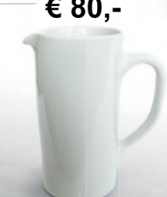
€ 80,- Krug ergonomisch 1 Liter