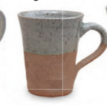
je € 25,- Henkelbecher konisch ganz- oder halb gliert, 0,33 Liter