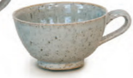
€ 28,- Tee- und Kaffeetasse ganz gliert, 0,3 Liter, ø ca. 13 cm