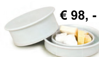
€ 98,- Porzellan-Kasedose mit Wasserrinnen-Verschluss ø ca. 20 cm