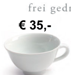
€ 35,- Teetasse 0,3 Liter, ø ca. 16 cm