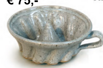
€ 75,- Gugelhupfform ganz gliert, ø ca. 25 cm