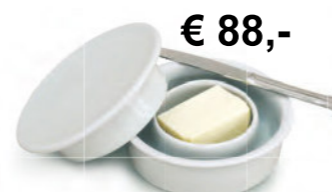
€ 88,- Porzellan-Butterdose mit Wasserrinnen-Verschluss ø ca. 16 cm