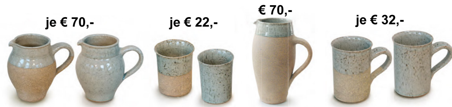
je € 70,- je € 22,- € 70,- je € 32,- Krug bauchig halbgliert, 0,5 oder 1 Liter Krug bauchig ganz gliert, 0,5 oder 1 Liter Irinkbecher ganz- oder halb gliert, 0,25 Liter Krug eifrmig teilweise gliert, 1 Liter Henkelbecher ganz- oder halb gliert, 0,5 Liter