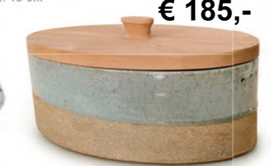
€ 185,- Brotdose teilweise gliert, mit Holzdeckel, ca. 33 x 22 cm, Hhe ca. 13 cm