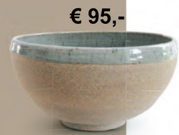
€ 95,- Obst- und Salatschssel halbrund teilweise gliert, ø ca. 28 cm, Hhe ca. 12 cm