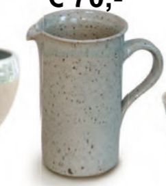
€ 70,- Krug zylindrisch ganz gliert, 1 Liter