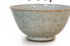
€ 35,- Ess- und Trinkschale ganz gliert, 0,4 Liter, ø ca. 16 cm